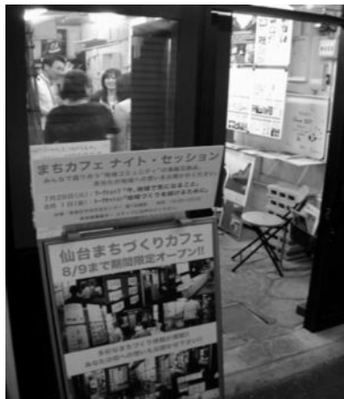
▲ 仙台まちづくりカフェ2008

※「仙台まちづくりカフェ」:まちづくりについて、“人と人が出会い情報が交わされる場”(=カフェ)を仙台につくろうと、都市デザインワークスを含む、まちづくりNPO8団体で運営する、壱式参横丁(仙台市青葉区)に期間限定でオープンするコミュニティスペース。2007年度から試みられている取り組み。