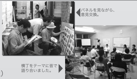
パネルを見ながら、意見交換。